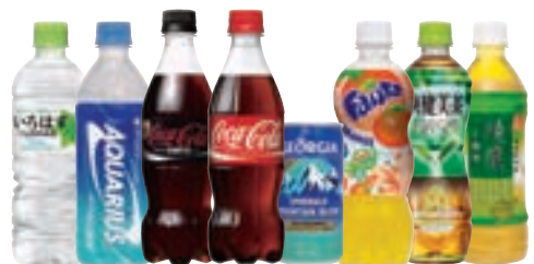
▲コカ・コーラ社製品