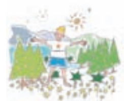
▲「市村自然塾 九州」 への寄付